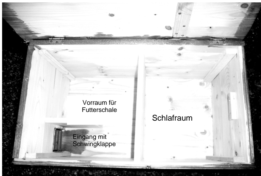
Innenansicht des Schlaf- und Futterhauses für Igel mit hochgeklapptem Dach